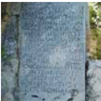
© IG.XII 6 2, 331 Samos/ Photographie : Gabrielle FRIJA